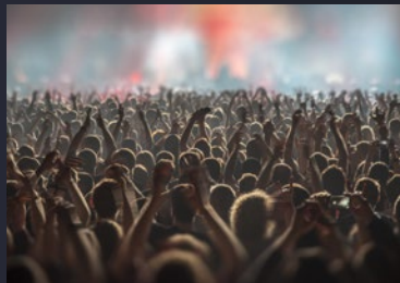
コンサートやファンイベントのライブ配信