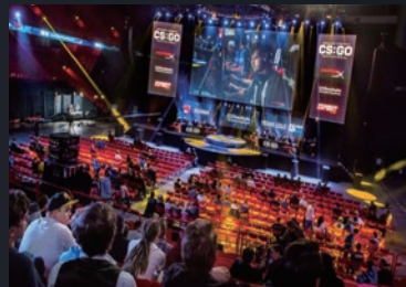
ゲーム・eスポーツの実況中継