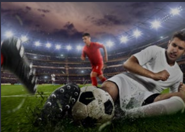
スポーツイベントのライブ配信

スポーツやゲームその他の応答時間に厳しいイベントにも、1秒未満の遅延で安全にライブ配信が可能です。高品質のビデオを世界中のあらゆる場所の様々なデバイスへ、業界トップレベルの遅延で送り届けます。